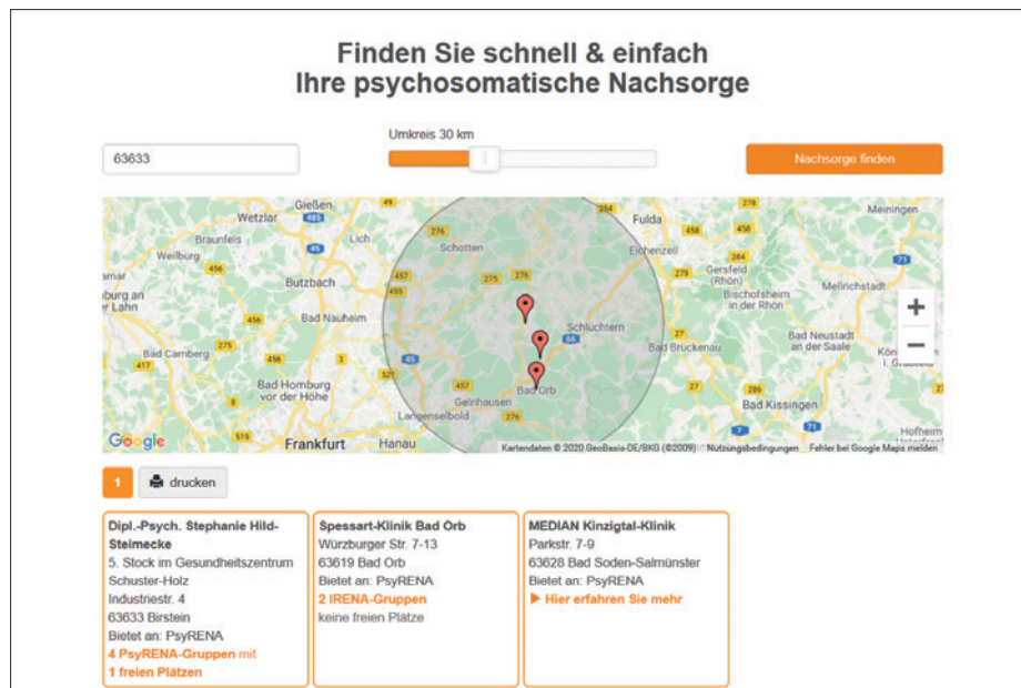
Abbildung 1: Umkreissuche

76 % der Nachsorgeanbieter sind auf psyrena.de registriert und nutzen die Selbstverwaltung.