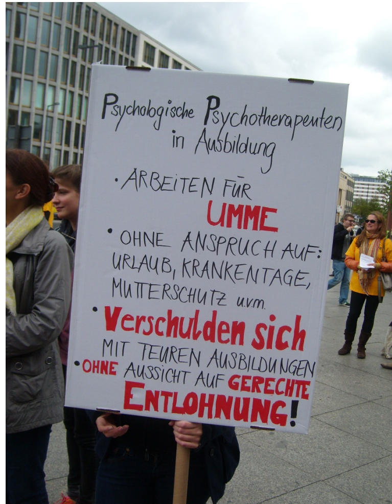
Quelle: Foto vom Aktionstag Psychotherapie am 25.09.14 in Berlin